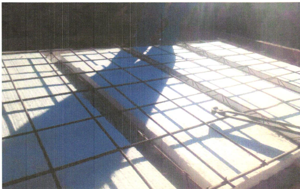
FOTO 07 – - Laje pré-fabricada treliçada para piso ou cobertura, intereixo 38cm, h=12cm, el. enchimento em EPS h=8cm, inclusive escoramento em madeira e capeamento 4cm