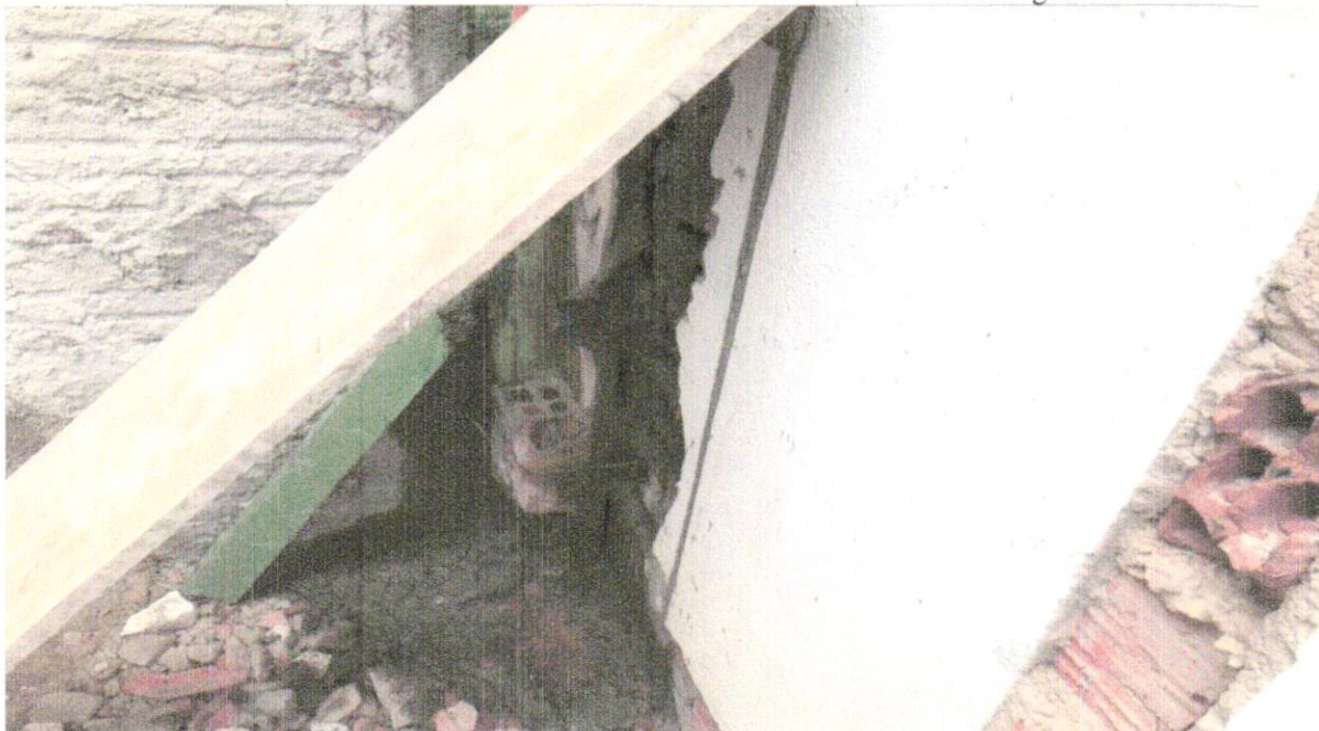
FOTO 03 - CONCRETO FCK = 20MPA, TRAÇO 1:2,7:3 (EM MASSA SECA DE CIMENTO/ AREIA MÉDIA/ BRITA 1) - PREPARO MECÂNICO COM BETONEIRA 400 L. AF_05/2021