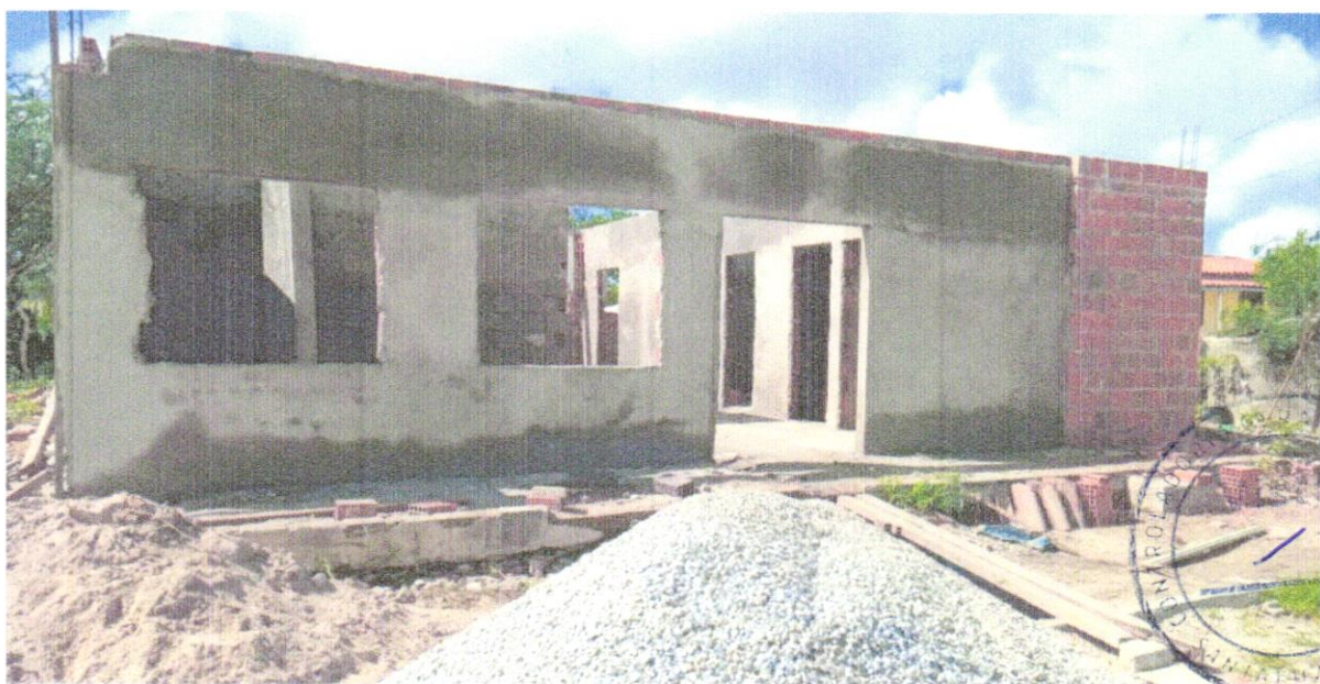
FOTO 06 – ALVENARIA DE VEDAÇÃO DE BLOCOS CERÂMICOS FURADOS NA HORIZONTAL DE 9X19X29 CM (ESPESSURA 9 CM) E ARGAMASSA DE ASSENTAMENTO COM PREPARO EM BETONEIRA. AF_12/2021