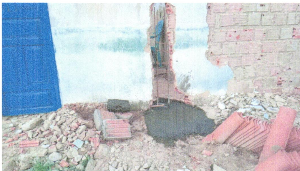
FOTO 01 – LASTRO DE CONCRETO MAGRO, APLICADO EM BLOCOS DE COROAMENTO OU SAPATAS, ESPESSURA DE 3 CM. AF_08/2017